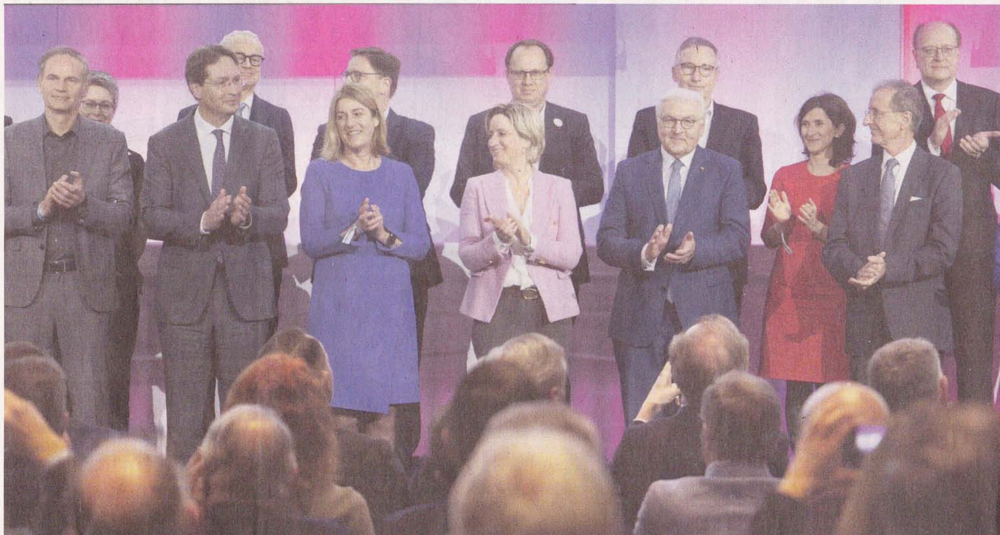
Zur Unterzeichnung der Erklärung „Wirtschaft für Demokratie“ umrahmen viele hochkarätige Gäste Bundespräsident Frank-Walter Steinmeier (4. von re.) auf der Bühne.